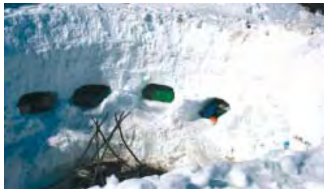
Le "trune" scavate nella neve: è lì che hanno dormito i capi scout arrivati da tutta l'Italia impegnati nello stage invernale!

Una dimostrazione che si può imparare a conoscere la montagna d'inverno, ed anche a viverla in situazioni estreme, senza bisogno di correre (e di far correre!) alcun pericolo, né a sé, né ai ragazzi di cui i capi avranno la responsabilità in futuro, né ai volontari del Soccorso alpino, troppo spesso chiamati ad intervenire in situazioni che avrebbero potuto essere facilmente evitate.